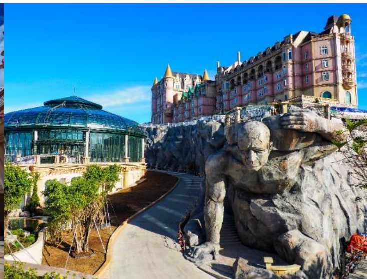
บรรยากาศเทพนิยายมหัศจรรย์ นอกจากมุมมองต่างๆ ด้านบนของบานาฮิลล์

เย็น ๑๐ รับประทานอาหารเย็น (เนื้อที่2) บุฟเฟ่ต์นานาชาติ ณ ภัตตาคารบนบานาฮิลล์